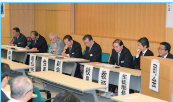
常任幹事・幹事会A