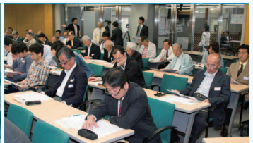
常任幹事・幹事会B