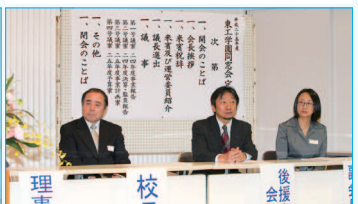
校長・後援会・東工会