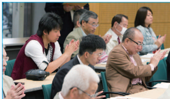
常任幹事・幹事会C