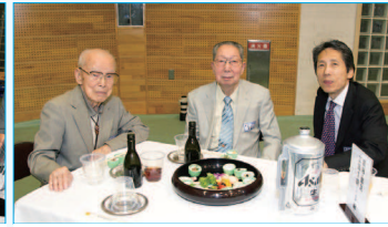
業夜・業定と教頭